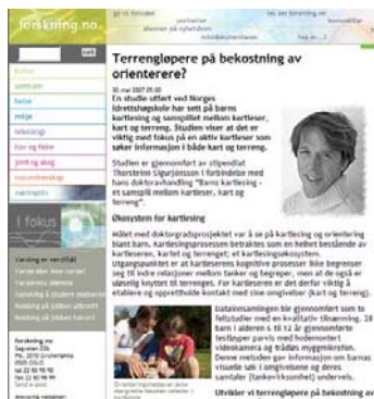
Sak publisert på forskning.no